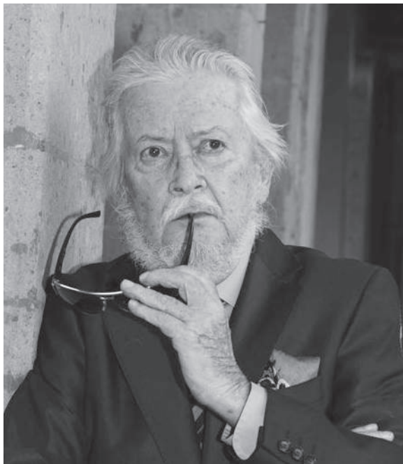
FERNANDO DEL PASO